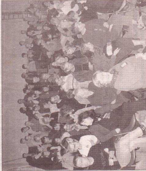
Le public était venu en nombre pour voir le spectacle